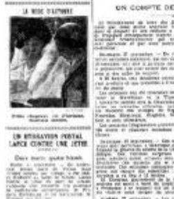
LA BATAILLE DE BORDOUILLE

LA BATAILLE DE BORDOUILLE UN BATAILLON PORTAIS LAITIER CONTRE UNE LETTE