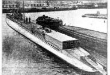
LE « PERSÉE » DANS L'ARMÉE MER DE COMMERCE

L'EXPLOSION A BORD DU « PERSÉE » Il y a trois morts et sur les trente blessés trois sont encore dans un état très grave Des prodiges de sang-froid et de dévouement UNE ENQUÊTE EST OUVERTE POUR RECHERCHER LES CAUSES DU TRAGIQUE ACCIDENT