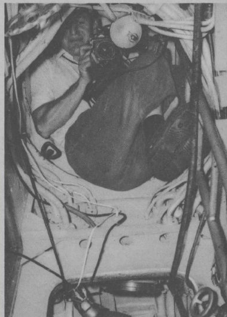
Le métier de cameraman à bord d'un sous-marin n'est pas toujours de tout repos.

Cette extraordinaire réalisation technique à la gloire de notre marine nationale a été un succès.